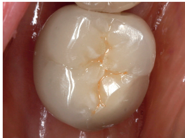
Abb. 8: Absplitterung an einer Keramikkrone

Schmerzen im Bereich der Wangen, der Schläfen und vor den Ohren weisen auf die Überlastung der Kaumuskelatur und der Kiefergelenke hin. Typisch für Patienten mit Schlafbruxismus sind z. B. Schläfenkopfschmerzen oder Schwierigkeiten bei der Kieferöffnung („wie eingerostet“) am Morgen. Aber auch Ermüdungserscheinungen der Kaumuskelatur oder überempfindliche Zähne können unmittelbare Folge von Bruxismus sein. Spüren Sie solche Beschwerden eher im Verlauf oder am Ende des Tages, leiden Sie möglicherweise an Wachbruxismus.