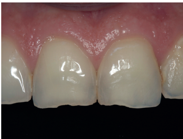
Abb. 11: Absplitterungen am Zahnschmelz

Die Physiotherapie leistet im Rahmen der Funktionstherapie einen wichtigen Beitrag zur Entspannung der Kaumuskelatur und der Verbesserung der Beweglichkeit der Kiefergelenke. Insbesondere bei Wachbruxismus können Übungen zur Achtsamkeit und Selbsthilfe vermittelt und trainiert werden.