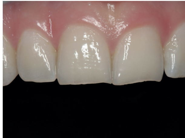
Abb. 2: Beginnende Abnutzung bei 19-jähriger Patientin

Während die normale Abnutzung der Zähne mit etwa 50 µm/Jahr angegeben wird, kann der Verlust von Zahnschubstanz bei anhaltendem Bruxismus um ein Vielfaches zunehmen (Abb.1).