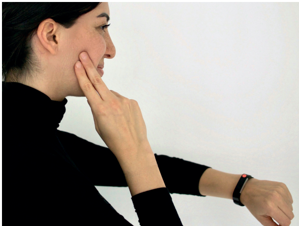
Abb. 15: Rote Punkte zur „Selbstbeobachtung“

Bei Wachbruxismus kann die Selbstbeobachtung helfen. Normalerweise sollten Sie bei geschlossenem Mund keinen Zahnkontakt haben. Kleben Sie einen farbigen Aufkleber (im Bürobedarf) auf Gegenstände in ihrer Umgebung. Dazu eignet sich zum Beispiel die Armbanduhr (Abb. 15), der Monitor Ihres Computers, das Handy oder der Autorückspiegel. Immer wenn Sie den Punkt sehen, kontrollieren Sie die Stellung der Zähne zueinander. Sollten Sie sich ertappen, die Zähne zusammenzuhalten, öffnen Sie den Mund weit und schließen Sie ihn entspannt, ohne dass sich die Zähne berühren. Halten Sie die Lippen geschlossen, die Zähne auseinander!