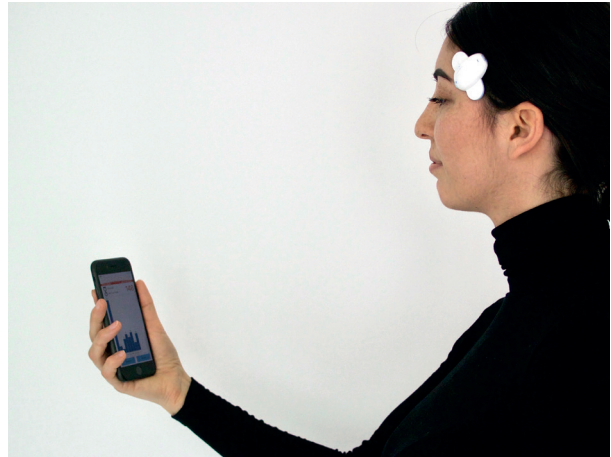
Abb. 10: Biofeedback: Stimulation der Kaumuskelatur

Bei Wachbruxismus kommen einfache verhaltenstherapeutische Maßnahmen zum Einsatz, wobei man lernt, sich die Angewohnheiten bewusst zu machen und aktiv zu vermeiden („Selbstbeobachtung“).