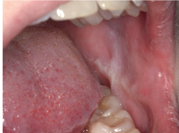
Abb. 6: Weiße Linie auf der Wangenschleimhaut

Auch wiederholt auftretende Schäden an Restaurationen, wie Absplitterungen an der Keramik oder Brüche von Prothesen oder Implantatversorgungen, können auf erhöhte Bruxismusaktivität hinweisen (Abb. 7, 8).