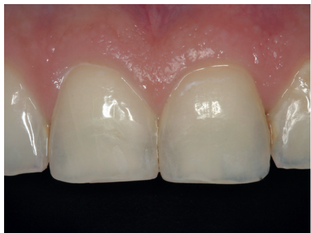
Abb. 12: Reparatur mit Komposit