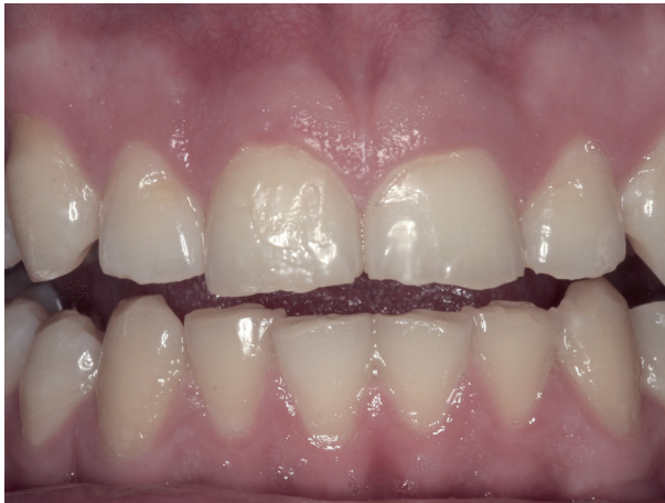
Abb. 1: Übermäßige Abnutzung bei 18-jährigem Patienten

Manche Patienten werden von ihrem Partner oder ihrer Familie auf Knirschgeräusche im Schlaf aufmerksam gemacht, andere wachen in der Nacht mit zusammengebissenen Zähnen auf. Viele Patienten merken aber gar nicht, dass sie über das normale Maß hinaus mit den Zähnen knirschen oder pressen. Spuren erhöhter Bruxismusaktivität zeigen sich aufgrund der häufigeren Zahnkontakte oft schon frühzeitig in Form übermäßiger Zahnabnutzung .