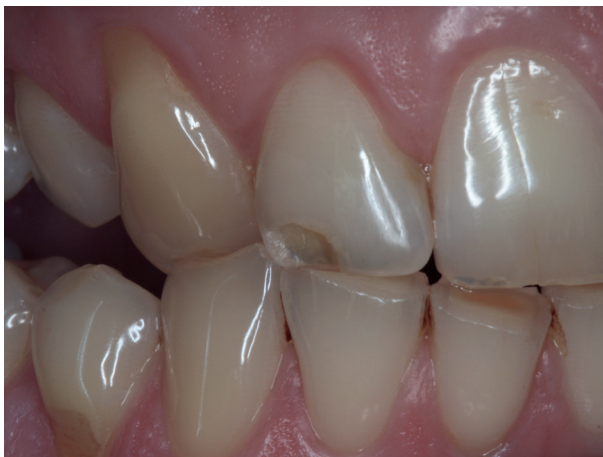
Abb. 3: Schliiffacetten gegenüberliegender Zähne

Die Kaumuskeln werden durch die andauernde Aktivität kräftiger, vergrößern sich und sind auch äußerlich deutlicher zu erkennen (Abb. 4)