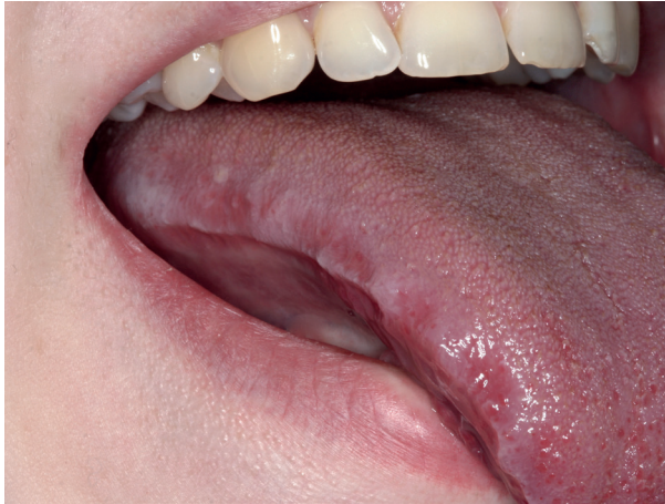
Abb. 5: Zahnabdrücke am Zungenrand

Presst man mit den Zähnen finden sich oft Zahnabdrücke am Zungenrand (Abb. 5) und weiße Linien in Höhe der Zahnreihen auf der Wangenschleimhaut (Abb. 6).