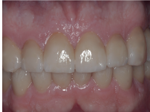
Abb. 14: Rehabilitation mit Lithiumdisilikatkeramik-Kronen