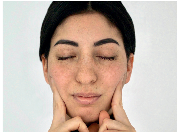
Abb. 16: Lippen geschlossen, Zähne auseinander!