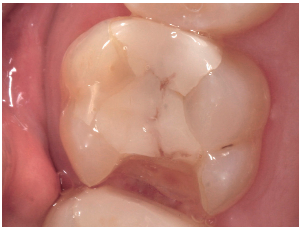
Abb. 7: Bruch einer Kompositfüllung

Auch wiederholt auftretende Schäden an Restaurationen, wie Absplitterungen an der Keramik oder Brüche von Prothesen oder Implantatversorgungen, können auf erhöhte Bruxismusaktivität hinweisen (Abb. 7, 8).