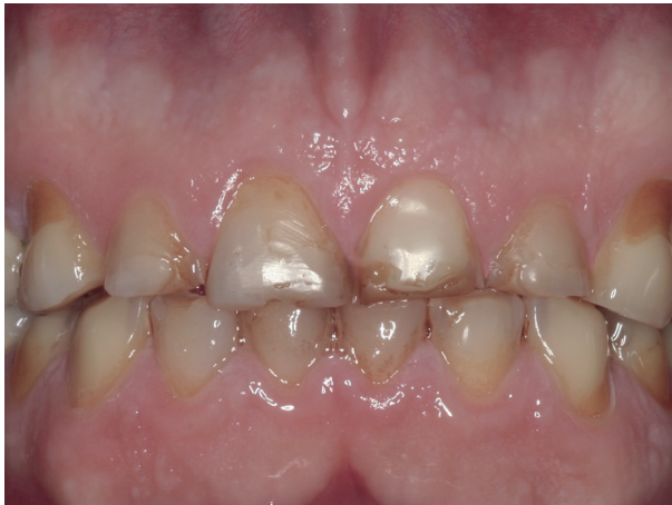
Abb. 13: Fortgeschrittener Zahnverschleiß

Schäden an den Zähnen können, je nach Art und Umfang, mit keramikverstärkten Kunststoffen (Komposit, Abb. 11, 12) oder mit Teilkronen oder Kronen wiederhergestellt werden (Abb. 13, 14).